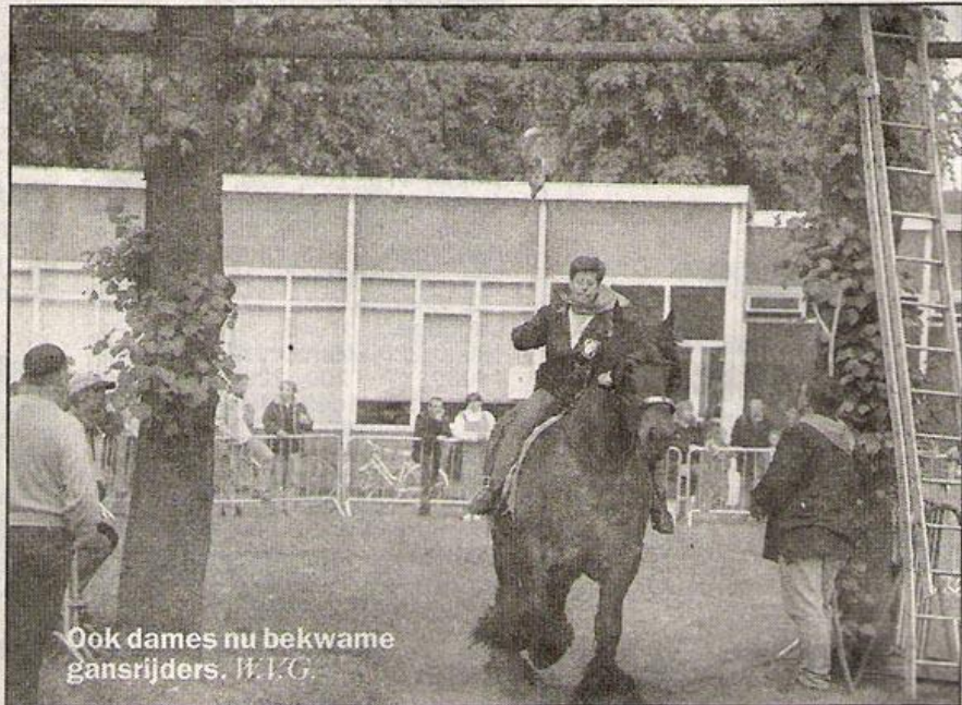
Ook dames nu bekwame gansrijders.