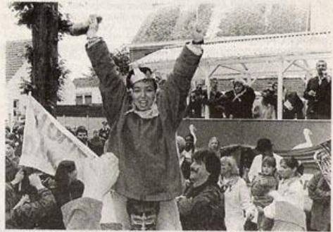
De nieuwe koningin van de Vrije Gans steekt jubelend de kop in de hoogte.

schouders de hoogte in. Wij wensen haar van harte proficiat. En wanneer nemen de vrouwen deel aan het Ketzerrijden? Het bestuur van de Vrije Gans dankt van harte alle sponsors, sympathisanten en alle „helpende handen“. „Zonder hen stonden we nergens“, aldus de gansrijdsters.